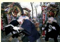
どうさいえんぶり